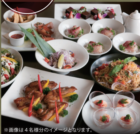
※画像は4名様分のイメージとなります。