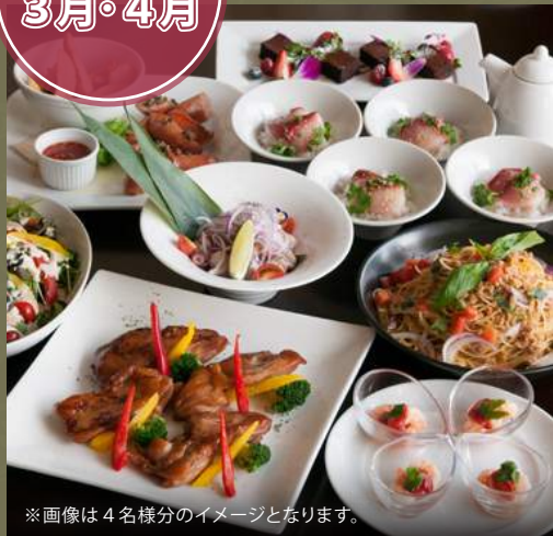
※画像は4名様分のイメージとなります。